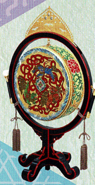
幕府が支えた 雅楽と能楽