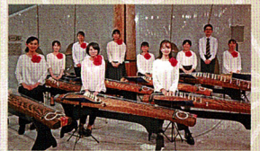
浜松ジュニア・ユース邦楽合奏団